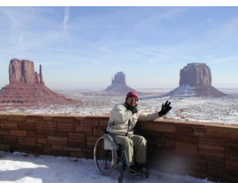
モニュメントバレー／米国