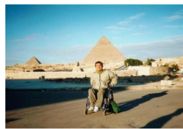
ピラミッド／エジプト