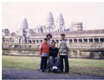
アンコールワット／カンボジア