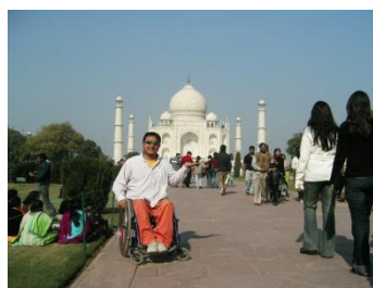
タージマハル／インド